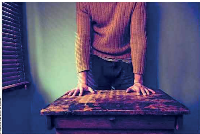
Un spectacle qui éveille à la citoyenneté

« Il va falloir élire un délégué, il a dit le professeur principal. Qui veut se