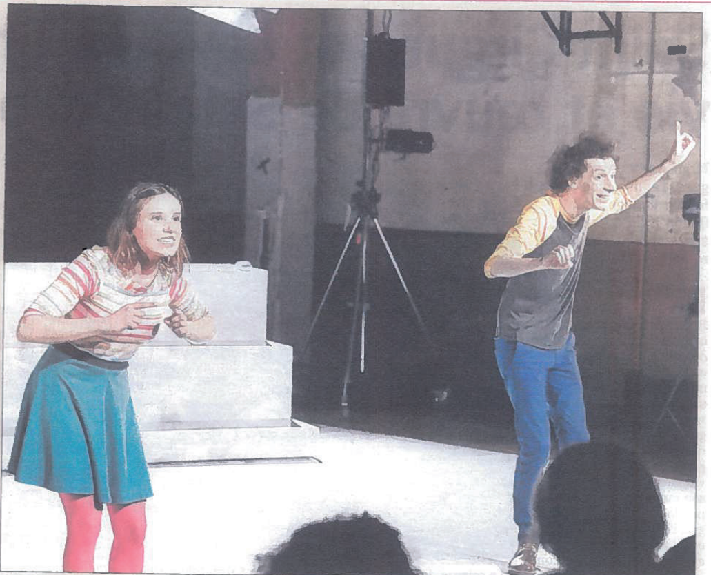
■ Deux jeunes acteurs issus de l'école de la Comédie interprètent tous les personnages.

2002. À chaud après le premier tour des élections, Boris Leroy écrit un roman pour la jeunesse. Il y raconte l'histoire de collégiens qui doivent élire leur délégué de classe. Deux héros aux idées opposées s'affrontent : Anard et Cachot. Lune, sert de pivot sentimental à l'affaire. Elle est sans papiers et vient juste d'arriver. Émilie Capliez a adapté ce roman pour le théâtre. Sur scène, deux jeunes acteurs issus de l'école de la Comédie interprètent tous les personnages, dans un décor astucieusement scénographié. C'est là que les personnages suent sang et larmes, s'embrassent et s'amuse, tout en décortiquant les règles et les pièges de la démocratie. Malicieux et pédagogique à souhait, malgré certains passages un peu « bavards »... RENDEZ-VOUS Quand j'étais petit, je voterai , lundi 10 mars à 10 et 14 heures à l'Usine de la Comédie de Saint-Étienne, puis en tournée du 8 au 25 mars dans le cadre de la Comédie itinérante. À partir de 8 ans. Tél. 04.77.25.14.14. www.lacomédie.fr