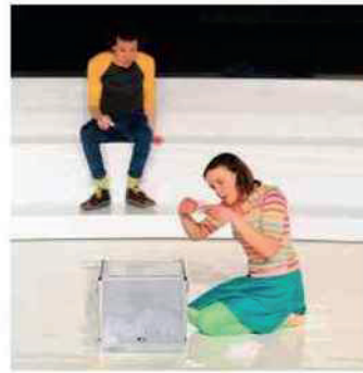
La cie La Party est associée à la Comédie de Saint-Etienne

Un spectacle réalisé d'après le livre de Boris Leroy écrit lors des élections de 2002. Citoyenneté, démocratie, liberté d'expression, sont autant de